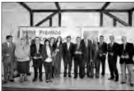
Entrega de los premios concedidos por la Cámara de Comercio.

Otorgado por la Cámara de Comercio de Cáceres