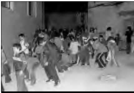
Niños hermanpereños recogen caramelos en la cabalgata. | G.O.

Organizados por la Biblioteca de Hernán Pérez