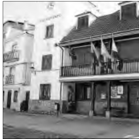
Fachada del ayuntamiento de Villanueva de la Sierra.

Hasta este momento, las obras en la residencia -situada en Las Heras- se venían realizando con cargo a los presupuestos municipales. A partir de ahora, Díaz Ser-