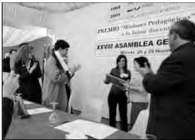
Recogida del Premio en Mérida el pasado mes de noviembre.

El premio, que está dotado con 1.500 euros en metálico, placa y diploma, trata de reconocer el esfuerzo, la dedicación, el trabajo y la trayectoria del profesorado extremeño.