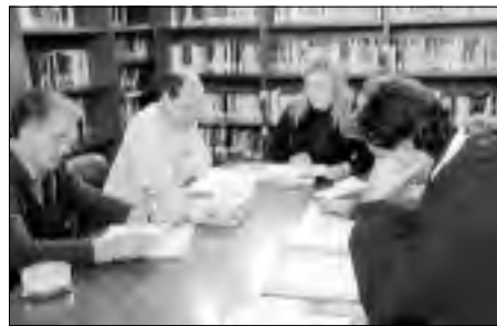
Equipo profesional de la Casa de Oficios El Zahurdón. | S.F.B.

Como formación complementaria van a realizar varios viajes formativos: Conocerán el funcionamiento de la presa de Alcántara,