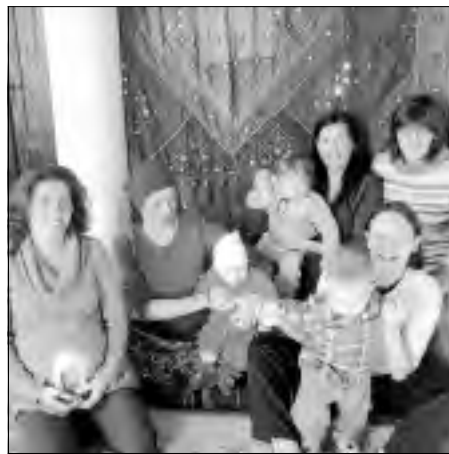
El grupo de apoyo a la familia Dulce Leche.

Dulce Leche utiliza la información para acabar con los numerosos prejuicios y falsos mitos que rodean la lactancia materna. Entre estos se encuentra la falsa creencia de que dar de mamar a demanda es perjudicial para el estómago del bebé, es perjudicial para el pecho de la madre -todo lo contrario- o que a partir del sexto mes es imprescindible complementar la alimentación materna porque ésta ya no es sufi-