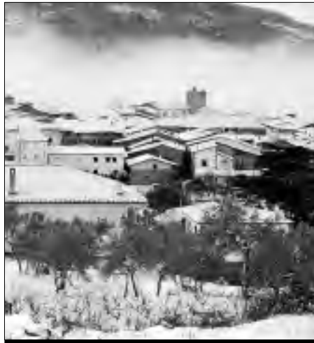
San Martín bajo el manto de la última nevada.

Quizás, por este motivo en 1924 los alcaldes de San Martín de Trevejo, Villamiel, Hoyos y Acebo decidieron que había llegado la hora de traer algo bueno a nuestras tierras, es por ello por lo que cogieron sus respectivas maletas, en las que portaban un interesante proyecto, y se desplazaron hasta Ciudad Rodrigo donde expusieron el deseo y el interés de traer el ferrocarril a este rincón apartado de la Península.