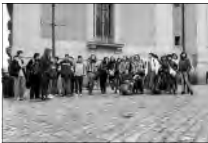
Valles de Gata a las puertas del Museo del Prado.

Lo que se trata es que aprendan a manejar el ratón, el teclado, escriban cartas, se comuniquen entre ellos, entre otras cuestiones. También que visiten los diferentes blogs que existen sobre Cilleros, para que vean las fotos antiguas de sus familiares o vecinos, enseñándoles como tienen que hacer para comentar dichas fotos.