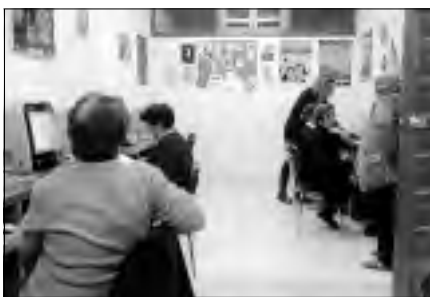
Alumnas del curso de alfabetización tecnológica en Cilleros.

Para incorporar las TICs a su vida cotidiana