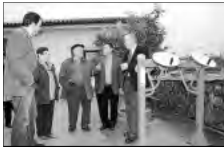
Entrega oficial del vehículo a los responsables municipales.