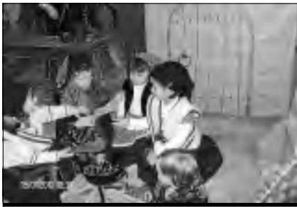
Pastorcillas en el Belén viviente de Perales del Puerto.

El día 5, los reyes magos trajeron en su cabalgata los premios a la mejor poesía, la tarjeta más bonita y belén más original realizados en los talleres de navidad.