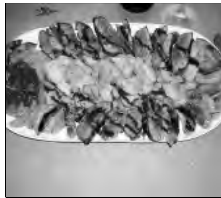
Magret de pato con frutas salteadas en Michel.