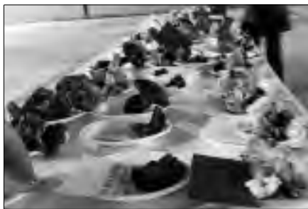
Clasificación de las setas en las II Jornadas micológicas. S.F.B.