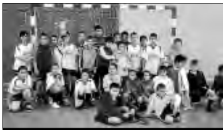
Participantes en el torneo infantil celebrado en Perales del Puerto. | D.E.

sultado fue de 0-5 para los chicos y chicas de Cilleros; en cuanto a la competición alevín la primera semifinal reflejó un 2-2 en el electrónico por lo que hubo que desempatar desde el punto de penalti, pasando Perales del Puerto a la Final. En la otra semifinal fue Torre de Don Miguel quien obtuvo el pase a la finalísima.