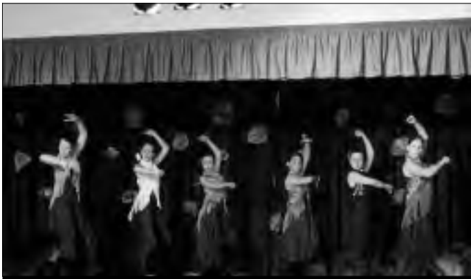
El grupo Zapatio Andalusi, de Vegaviana en una actuación.

Teatro, música, danza y cuentacuentos en los pueblos serranos