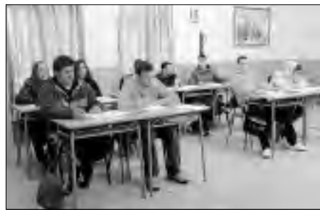
Alumnos de la Casa de Oficios El Zahurdón en Cilleros. | S.F.B.

visitarán dos plantaciones fotovoltaicas en Galisteo y también acudirán a varias ferias sectoriales en Madrid, Sevilla y Badajoz.