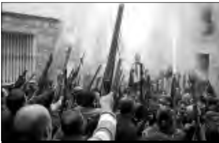
Fiestas de San Blas 2009 en Cilleros.