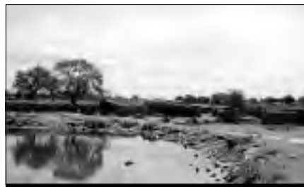
Pajares de Santibáñez el Alto.

pueden ponerse en contacto con ASESGAT en el teléfono 607.346.603 o a través del correo electrónico, asesgat@hotmail.com.