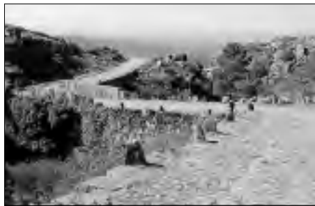
Camino señalizado en el Puerto de Castilla.