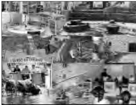
Proyectos financiados por Adisgata con ayudas europeas.