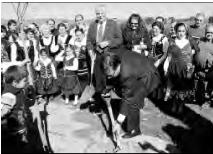
El presidente de la Junta en la 204ª Fiesta del Árbol de Villanueva de la Sierra.