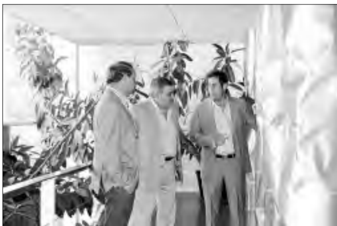
El consejero de Agricultura junto con el director del Centro durante la inauguración.

Con esta formación el alumnado ha obtenido la certificación del módulo de Desbroce en Masa Forestales y Primeros Auxilios en el monte perteneciente al Certificado de Profesionalidad de Trabajador/a Forestal. Esta certificación es acumulable para la obtención de dicho certificado. El Curso ha sido realizado por 17 alumnos y alumnas de la localidad y de otras po-