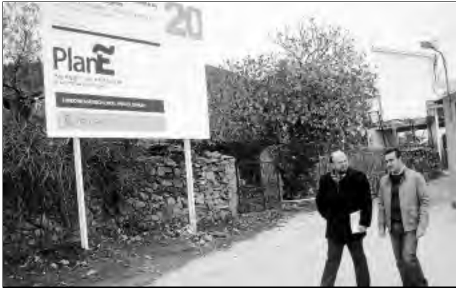
El subdelegado del gobierno junto al alcalde de Torrecilla de los Ángeles visitan los proyectos financiados con el Plan E en la localidad.

Torrecilla de los Ángeles realizará la II fase del cambio de redes de aguas, saneamiento y pavimentación en la calle Buenos Aires, la