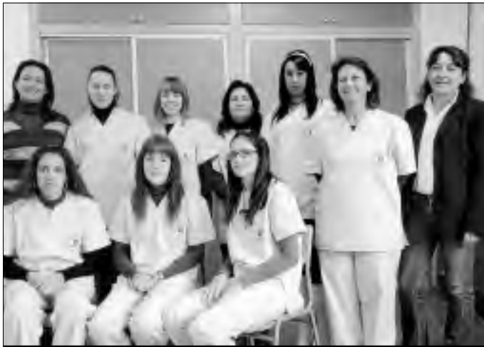
Alumnas y monitoras del PCPI de limpieza de alojamientos y catering en Vegaviana.

En cuanto a la formación específica, con Sonia Campos están