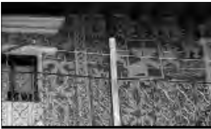
Antiguo convento franciscano de Robledillo.