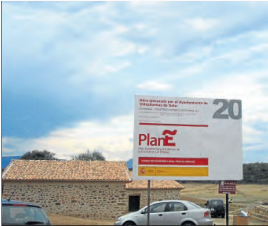
Recuperación de los edificios anejos a los Baños de la Cochina financiados con el Plan E 2009 en Villasbuenas de Gata. S.F.B.

Periodicidad: Mensual Edita: Editorial de Extremadura SA. Realiza: Mancomunidad de Sierra de Gata Imprime: SIO SL. Coordina Sara Fontán Teléfono: 608 50 40 96 D.L: CC-63-2008