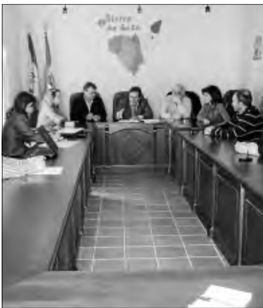
Firma del PTE en la sede de la mancomunidad de municipios. | S.F.

El objetivo es programar y desarrollar en el ámbito territorial de la Mancomunidad Sierra de Gata, un conjunto de medidas activas de empleo complementario entre sí, planificadas, pactadas y seguidas por una mesa territorial de empleo mediante la realización de diversas acciones que mejoren estructuralmente el nivel de empleo, en número y calidad y fortalecimiento del territorio.