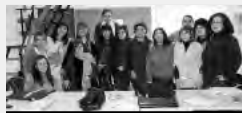
Las alumnas de las cuatro mancomunidades en Perales.

Las alumnas del programa de Inserción Socio Laboral (ISLA) de la Diputación han mantenido una reunión de coordinación con sus monitoras en Perales del Puerto. Las participantes pertenecían a las mancomunidades de Las Hurdes, Rivera de Fresnedosa, Va-