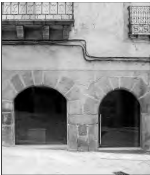
Museo Comarcal de la mancomunidad en Torre de Don Miguel. | E.I.

En 2008 la mancomunidad destinó 250.000 euros para mejorar a lo largo de los ejercicios posteriores la accesibilidad de los ayuntamientos en once de sus lo-