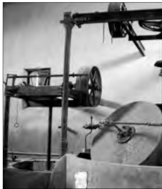
Museo del Aceite y el Vino de la mancomunidad en Hernán Pérez.

Sierra de Gata ha estado presente también en Europa a través del proyecto Astwood para el uso de la biomasa en el mundo rural. Entre otros, fruto de aquel proyecto, en el que participaban también Bulgaria y Portugal, fue la instalación de una caldera de