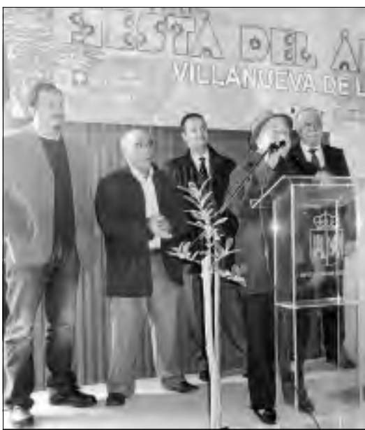
206 edición de la Fiesta del Árbol en Villanueva de la Sierra. S.F.

Como cada año, representantes políticos, vecinos y ARBA -Asociación para la Recuperación del Bosque autóctono- plantaron árboles en el bosque de las Ausentes, creado en 2009 como homenaje a las víctimas de la violencia