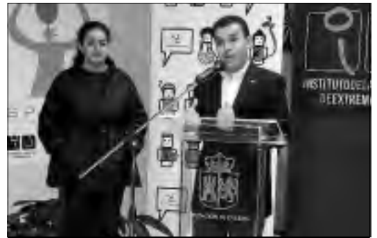
El consejero y la alcaldesa de Valverde durante la inauguración

Ahora es el turno de los jóvenes, que deberán hacer un uso