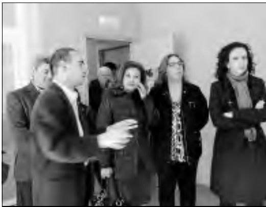
El arquitecto explica los detalles constructivos.

La Consejería de Igualdad y Empleo ha destinado 234.831 euros a las obras de este centro de educación infantil y algo más de