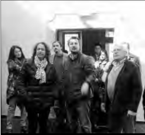
La consejera durante su visita a la Hospedería de San Martín.

Contará con 30 habitaciones y dos suites