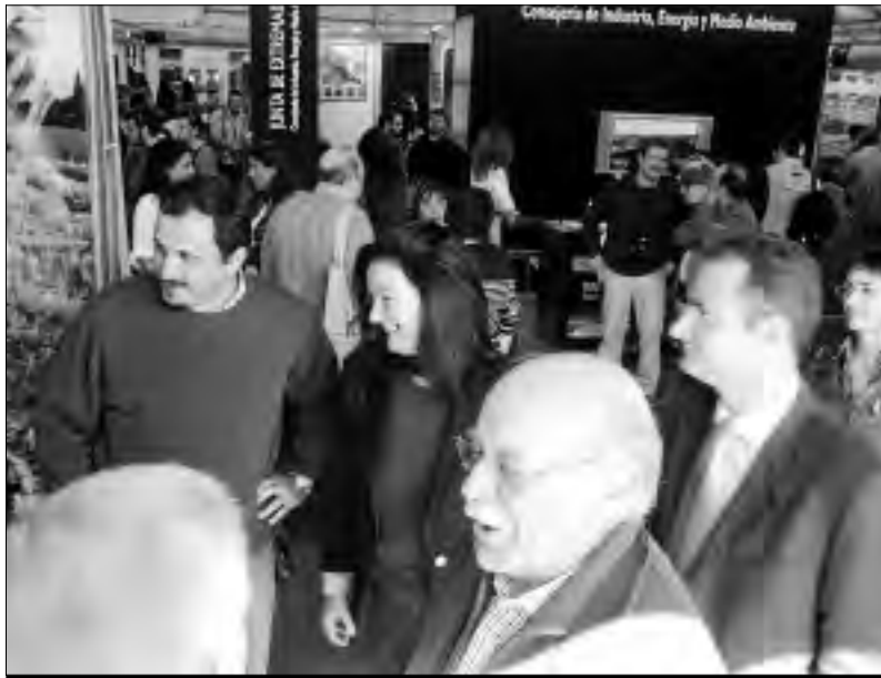
El director general del Medio Natural con el presidente de la mancomunidad en el stand de Sierra de Gata. | s.f.

La Mancomunidad Integral de Municipios ha venido desarrollando un importante trabajo con el fin de crear un producto turístico bien definido para los amantes del avistamiento de aves o birdwatching. Así por ejemplo, en el Valle del Árrago, dentro del