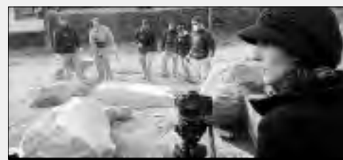
La cámara frente a los alumnos en San Martín de Trevejo.

El gobierno regional está preparando la celebración del XXV aniversario de las Acciones de Formación para el Empleo. La especialidad de cantería y mampostería del Taller de Empleo Sierra de Gata ha sido elegida, junto a otras cinco especialidades más de toda