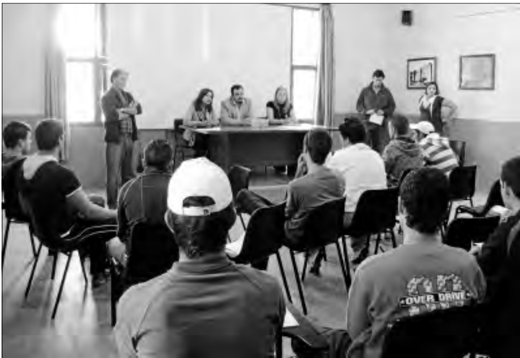
Inauguración de la Casa de Oficios El Zahurdón para menores de 25 años en Cilleros.

Desde 2007, la mancomunidad de municipios ha venido realizando una apuesta decidida por el turismo patrimonial y de natu-