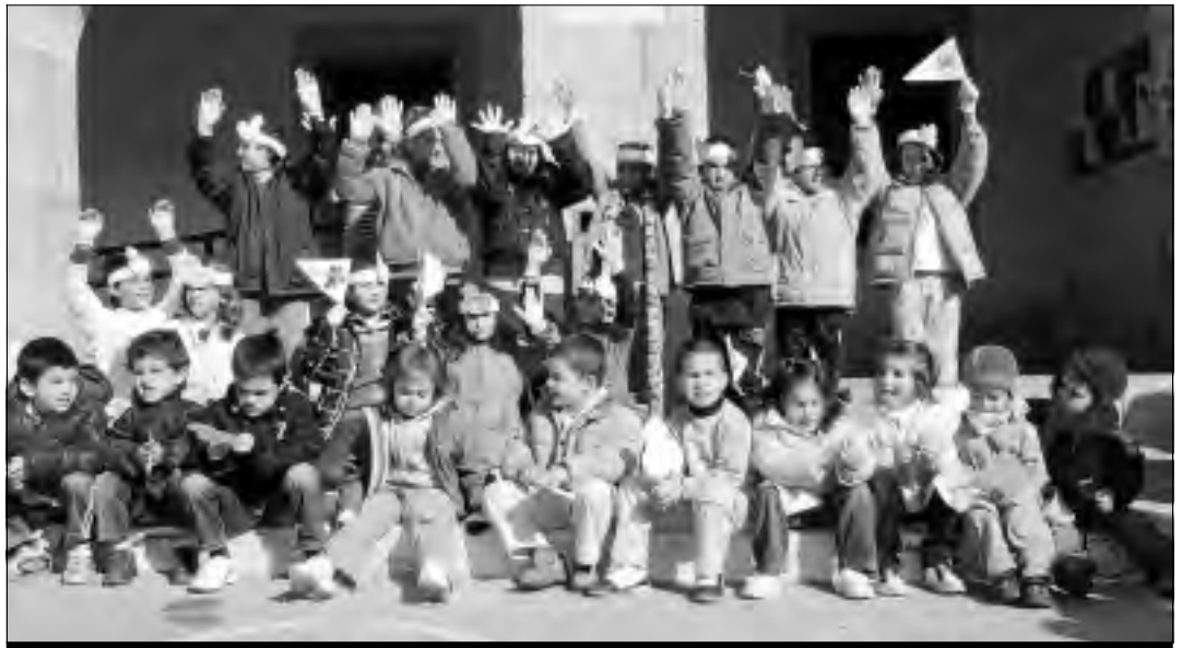
Los jovencísimos alumnos del colegio público de Acebo celebran el Día de la Paz.