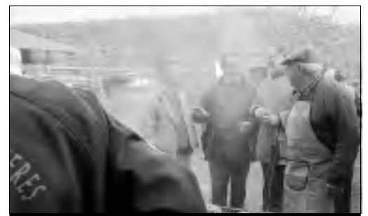
El exministro Bermejo junto al alcalde de la localidad.

bién han colaborado el ayuntamiento de Torrecilla de los Ángeles y la asociación Mensajeros de la Paz, que es la que gestiona el centro.