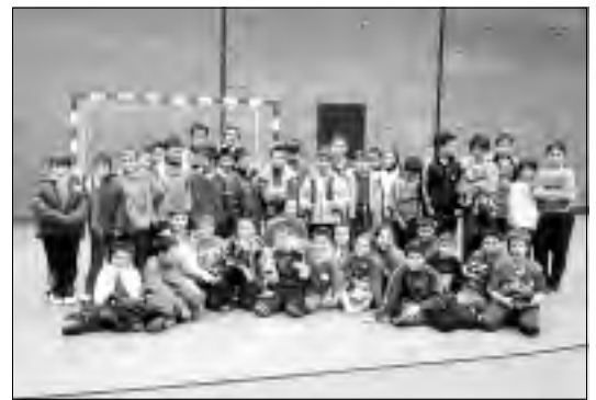
Equipos participantes en las últimas jornadas de JUDEX.

El ánimo se ha acrecentado en este grupo de jóvenes deportistas motivados por los excelentes resultados obtenidos, y además por sentirse muy apoyados por su entrenador, y desde la grada por familiares y amigos en todos los encuentros disputados, y ya ansian la fecha de la próxima concentración, pues la