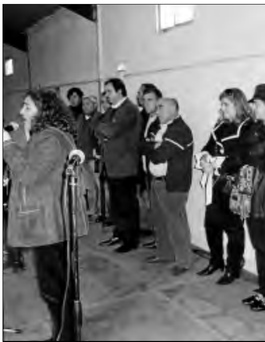
Los representantes políticos durante las intervenciones.