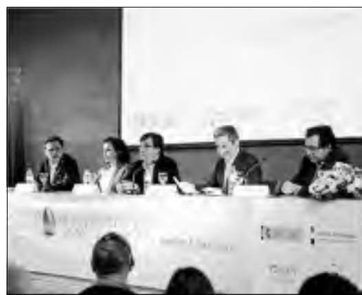
Firma del acuerdo para la creación de la escuela de Agroturismo.

Este encuentro, con una participación de 300 personas, ha invitado a reflexionar acerca del agroturismo y el turismo rural como motor de desarrollo y fuente de empleo, y en ella se ha informado sobre la futura puesta en marcha en Mérida del Centro de Referencia Nacional de Formación Profesional de Agroturismo