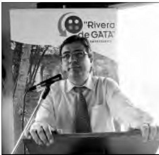
El presidente responde a las preguntas de los empresarios.

res ha provocado estos años de atrás "el abandono de la formación y las aulas por muchos jóvenes a edades muy tempranas".