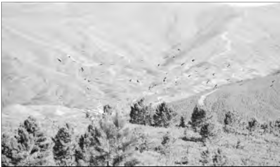
El muladar El Largujo de la mancomunidad en Descargamaría a pleno rendimiento.

Con el programa europeo Partexal la mancomunidad recuperó uno de los tres pajares cedidos por el ayuntamiento de la localidad pa-