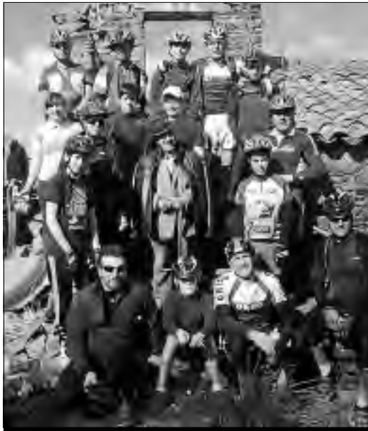
Foto de familia del AMPA Val de Xálima.

El objetivo de la ruta pretendía ser un día de convivencia entre los alumnos, padres y profesores del centro en un entorno inmejorable e idílico como es el paisaje serrano, todo ello, realizando una actividad físico-deportiva tan saludable y que aporta tantos beneficios fisiológicos a nivel personal y tan positivo para las relaciones sociales y familiares a nivel grupal.