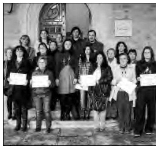
Imagen de la clausura del curso en el ayuntamiento de Hoyos.

cordó las próximas Residencias de Mayores autónomas y dependientes, los Centros de Día que existen en la zona y el Centro para enfermos de Alzheimer que se va a poner en marcha en Hoyos. Por este motivo, la mancomunidad viene organizando acciones formativas especializadas para el cuidado en residencias y en domicilios. Las acciones se dirigen principalmente al colectivo de mujeres puesto que, según las estadísticas, el 83% de los casos, es la mujer quien cuida de la persona dependiente.